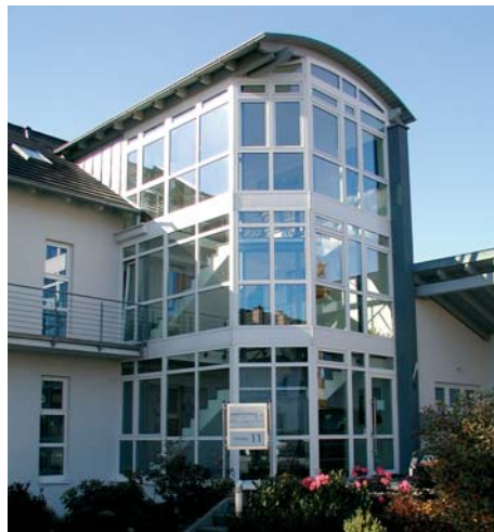
Firmensitz von Drimalski & Partner